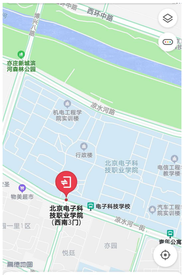
北京电子科技职业学院(西南3门)